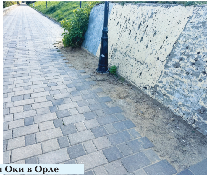
Набережная Оки в Орле

мостов». Полагаем, достаточное финансирование появится не скоро, учитывая плачевное состояние городского бюджета.