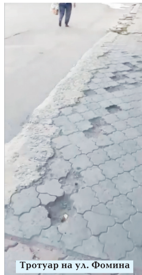
Тротуар на ул. Фомина