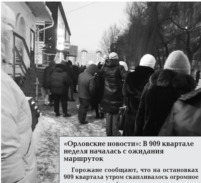
«Орловские новости»: В 909 квартале неделя началась с ожидания маршруток

На заседании комитета присутствовал и корреспондент «ОС», который по дороге в облсовет и обратно воочию наблюдал, как проводились те самые проверки, анонсированные мэрией. И так, отправляясь на заседание около