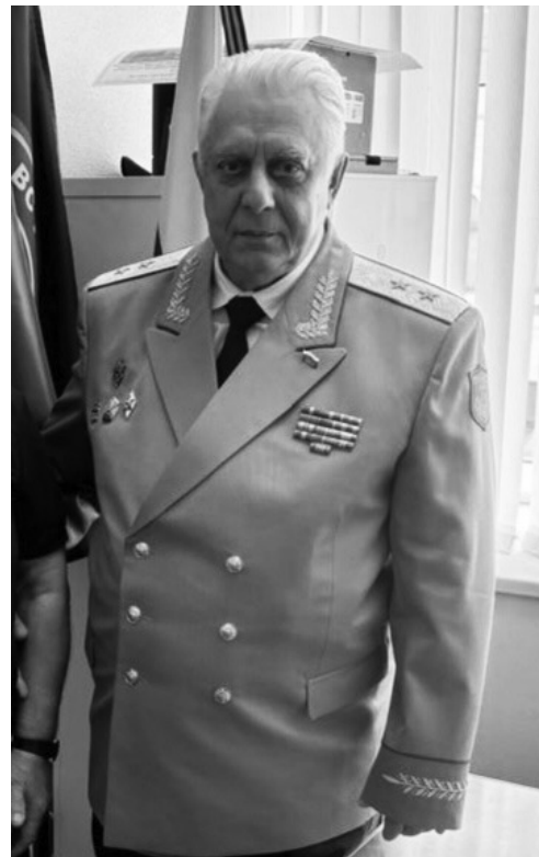
Заказной китель «генерала», уже по его размеру, сшитый в специальном ателье