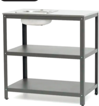
Стол с мойкой Patio P-02