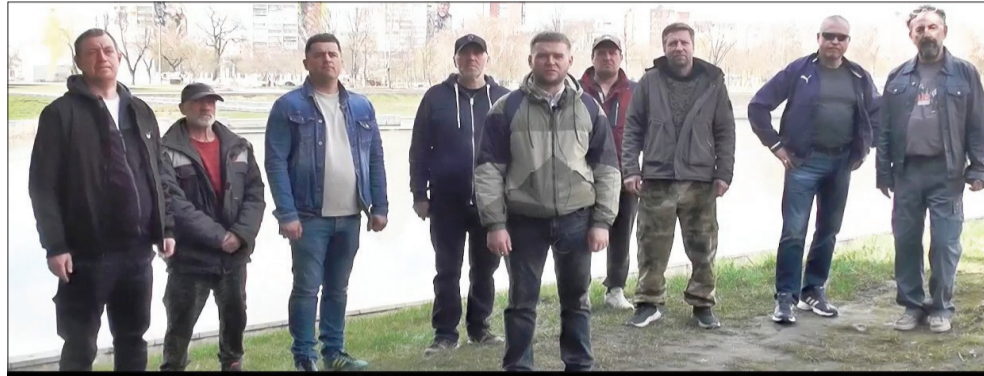
Обращение к Прокурору Орловской области по факту невыплаты заработной платы

Между тем, как стало известно «Орловской среде-плюс», ситуация далеко не так благополучна, как пытаются ее представить чиновники и подрядчик. Несколько десятков теперь уже бывших работников УПМК-22 свои честно заработанные деньги так и не