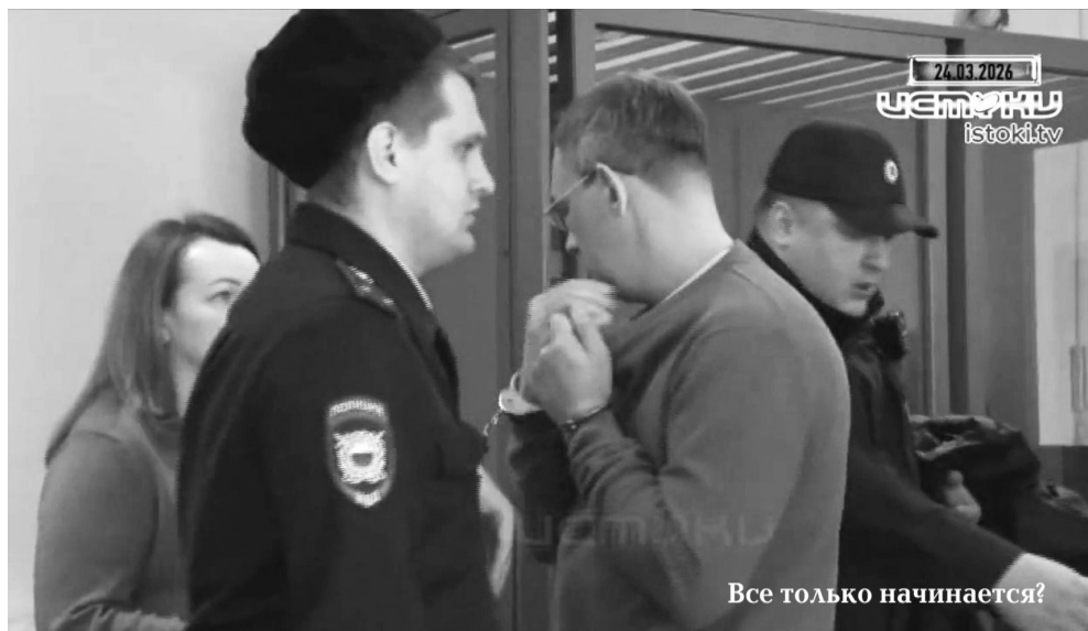
Все только начинается?