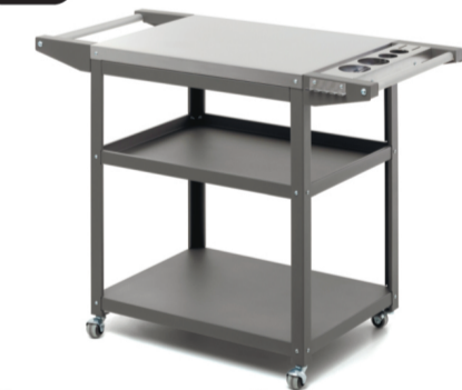
Стол передвижной Patio