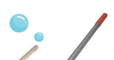
Окномойка Умничка 20 см 95см с телескопической ручкой