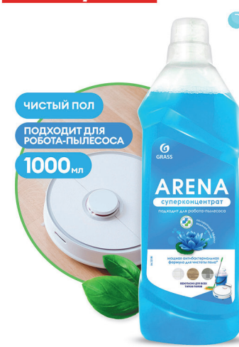
Средство для мытья полов GRASS ARENA 1000мл «Водяная лилия»