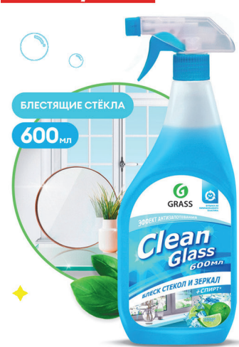
Средство чист. для стекол и зеркал GRASS CLEANER 600мл «Голубая лагуна»