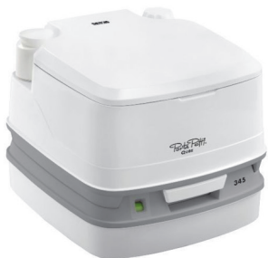
Биотуалет Porta Potti Qube 345

Средство дезинфекции туалетов состоит из ПАВ, консервантов, ароматизаторов, активных моющих компонентов, красителя и воды. В жидкости нет формальдегидов, хлора и прочих едких компонентов — каждый ингредиент безопасен для человека и природы.