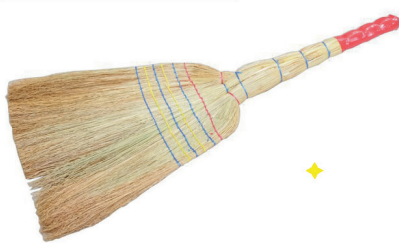
Веник Сорго ЛЮКС