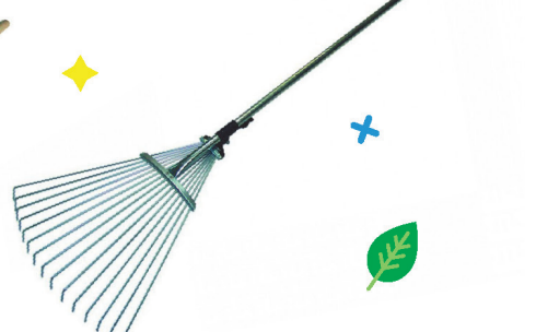
Грабли веерные складные