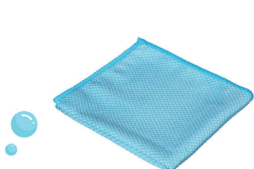
Салфетка микрофибра 30x30см для стекла 04-ALIC