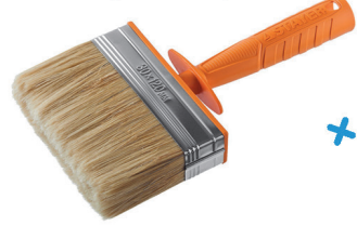
Кисть-макловица МИНИ 30x120мм 0182-12