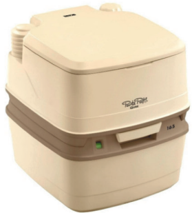
Биотуалет Porta Potti Qube 165L бежевый