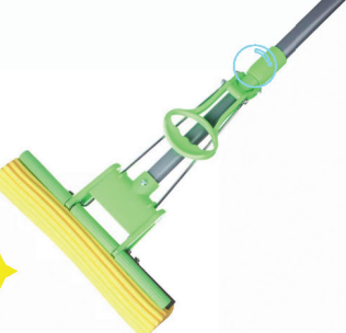
Швабра отжимная 7316PF однороликовая 444-049