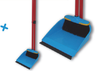
Комплект щетка + совок ЛЕНИВКА