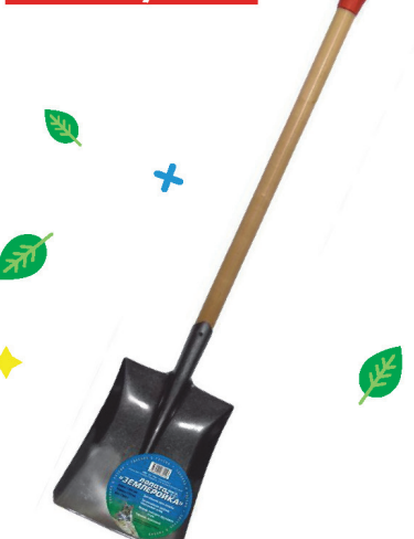
Лопата совковая ЗЕМЛЕ-РОЙКА рельс.сталь с/ч и ручкой 0114-ЧР