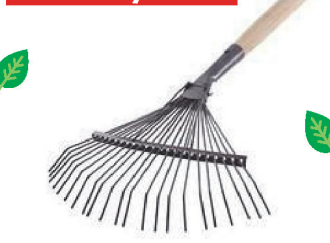
Грабли 22-х зубц. веерные проволочные R-122 с чер