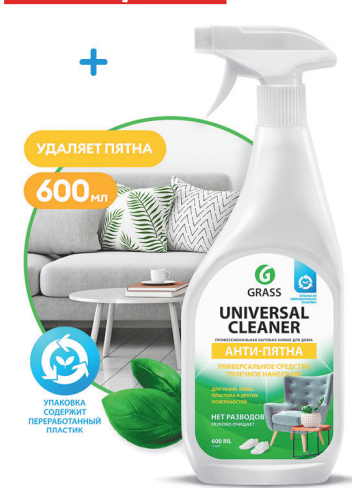
Средство чист. для различных поверхн. GRASS UNIVERSAL CLEANER 600мл с курком