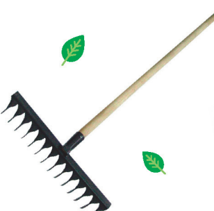
Грабли 14-ти зубцовые витые крашенные с чер