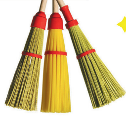
Метла №6 пластиковая круглая с черенком