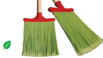
Метла №1 пластиковая мягкая