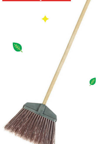
Метла синтет. Гардена с черенком

Внимание: реклама не является офертой. Все цены действительны на момент выхода рекламы. Количество товара ограничено.