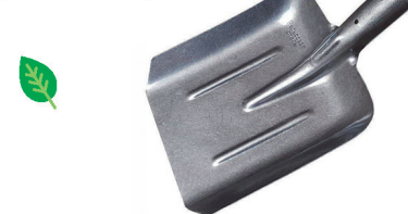
Лопата совк. песочная (тип2) ЛСП2 РЕЛЬСОВАЯ СТАЛЬ