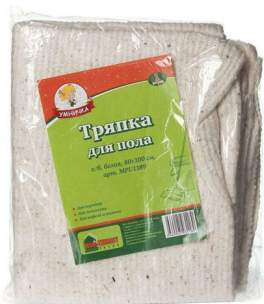
Тряпка для пола «Умничка» х/б белая 100x80см