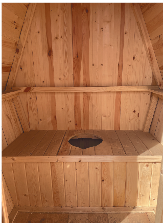
Туалет «ТЕРЕМОК» крыша профнастил

Туалеты для дачи представлены двумя основными разновидностями: конструкции, не оснащенные выгребной ямой; конструкции с выгребной ямой. Постройка в виде деревянного домика чаще всего имеет глубину 1 м, ширину 1,5 м и высоту в пределах 2,0-2,2 метра.