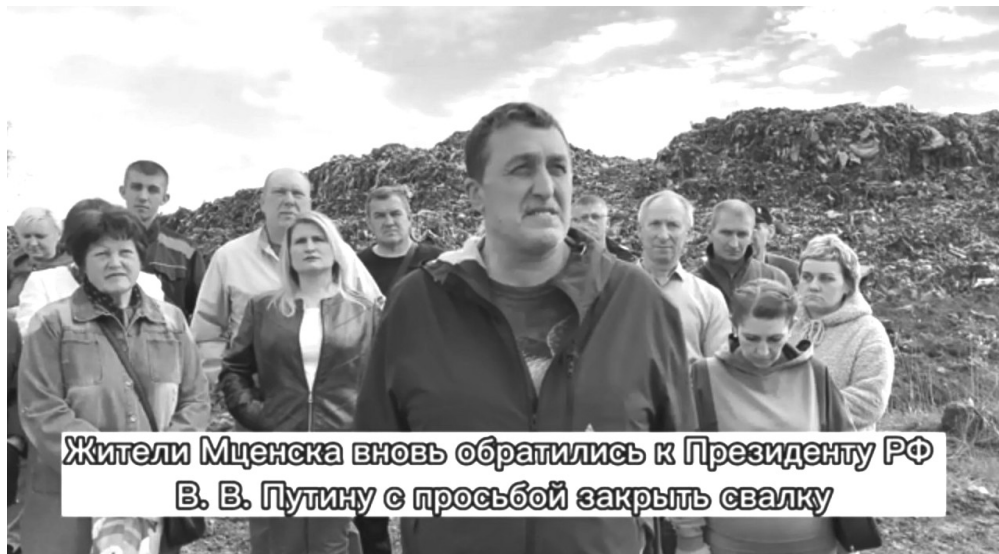
Жители Мценска вновь обратились к Президенту РФ В. В. Путину с просьбой закрыть свалку