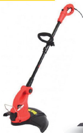
Триммер FORZA T580E 580 Вт