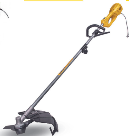
Триммер CHAMPION ET1211A