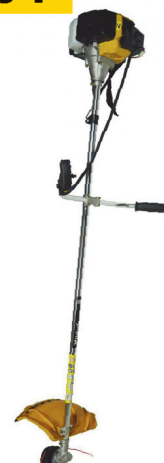
Бензотриммер HABERT HN-430E 1,5 л/с