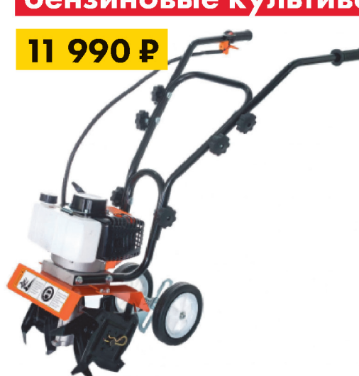
Культиватор Хопер МК-52 3 лс