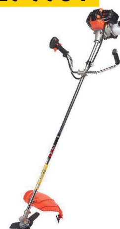
Бензотриммер HUSQVARNA 128R