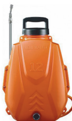
Опрыскиватель аккумулят. Finland 12 л Li-Ion