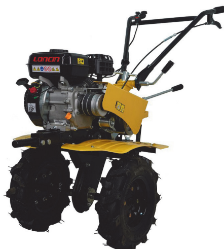
Мотоблок HАВЕРТ NM-22 Loncin H200 6,5 л/с колеса 4x8