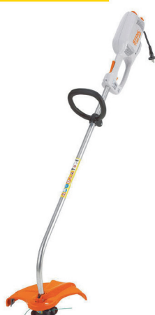
Триммер STIHL FSE 60 0,54 кВт 2,2 л/с