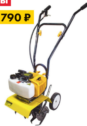
Культиватор CHAMPION GC 252 1,9 л/с