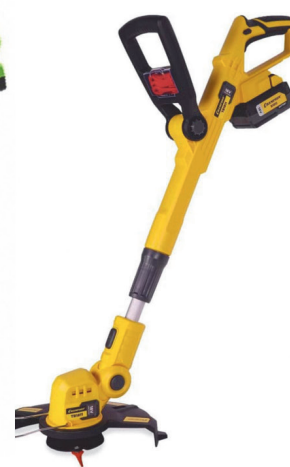
Триммер CHAMPION TB1811 с аккумулят.+3У