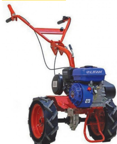
Мотоблок Агат Л-6,5 двигатель Lifan 6,5 л/с

Условия проведения акции и товары, участвующие в акции, уточняйте у продавца консультанта. Внимание: реклама не является офертой. Все цены действительны на момент выхода рекламы. Количество товара ограничено. Скидки по разным акциям не суммируются.