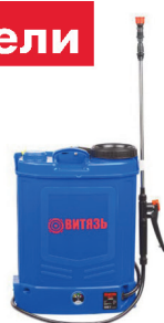
Опрыскиватель аккумулят. Витязь АО-12/1 12В 6 Ач