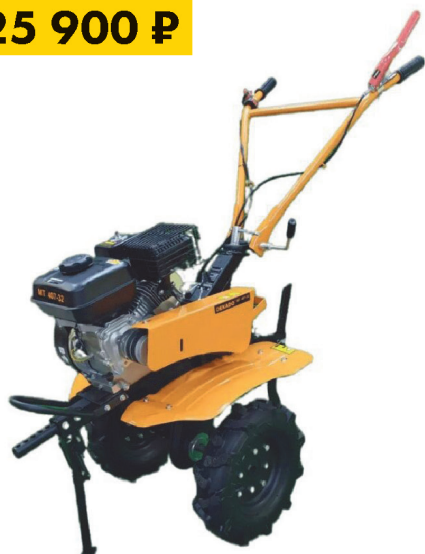
Мотоблок DEKADO MT 407-32 7 л/с колеса 4x8