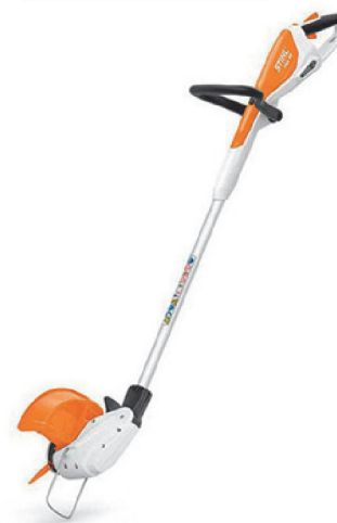
Триммер аккумулят. STIHL FSA 45

Внимание: реклама не является офертой. Все цены действительны на момент выхода рекламы. Количество товара ограничено.