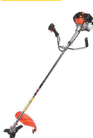
Бензотриммер BRAIT BR-520 2,9 кВт