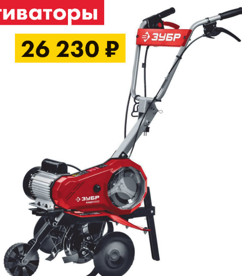
Культиватор ЗУБР 2500 Вт электрический