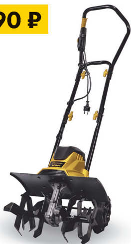
Культиватор CHAMPION EC 1200 1,2 кВт.