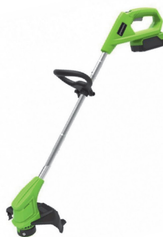
Триммер аккумулят. Greenworks G24LT25K2