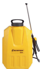
Опрыскиватель CHAMPION SA12 12л 12В 8Ач