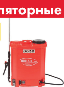
Опрыскиватель аккумулят. BRAIT BES 12AC 12B 8Ач