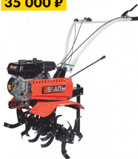
Мотокультиватор BRAIT МКР403 7,8 л/с, бенз., колеса 4x10