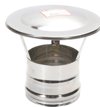
ЗОНТ (Д) 430/0,5