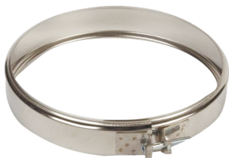
ХОМУТ ОБЖИМНОЙ 430/0,5