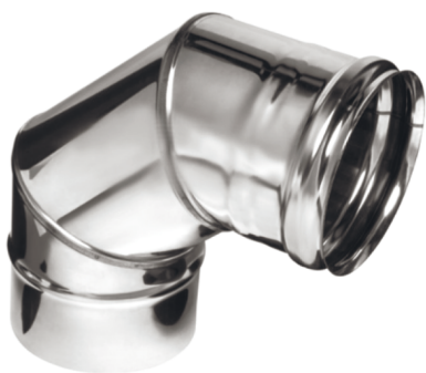
КОЛЕНО 90° (3 секции) 430/0,5