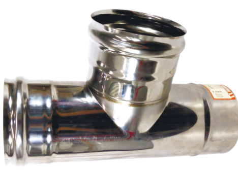
ТРОЙНИК 90° (Д) 439/0,8