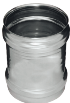
АДАПТЕР ММ 439/0,8