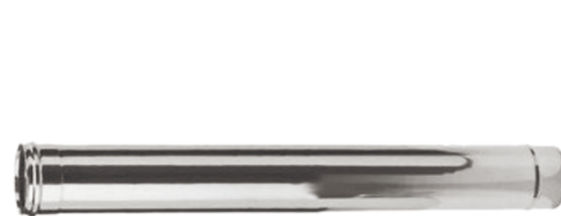
ДЫМОХОД (1 м) 439/0,8