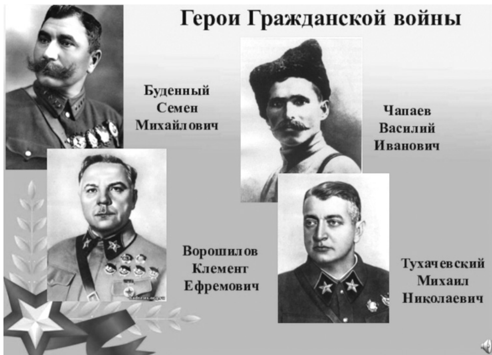
«Герои Гражданской войны» по версии Геннадия Зюганова и КППРФ

Моё личное мнение: в Гражданской войне не было, нет и не должно быть официально объявленных героев, как