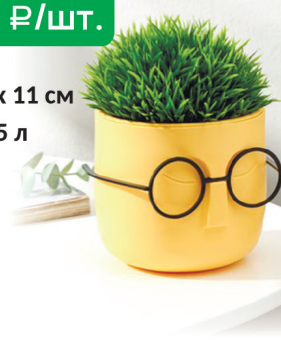
КАШПО СТИВ банан