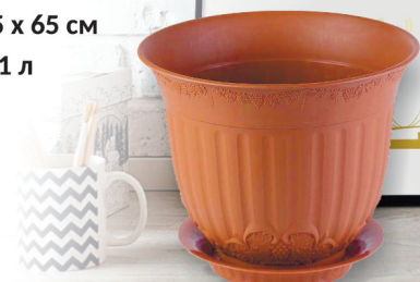
ГОРШОК СП ЕВРОПА терракот