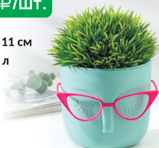
КАШПО МАРИ фисташковый