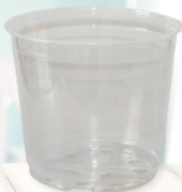
ГОРШОК ДЛЯ ОРХИДЕЙ МСН прозрачный