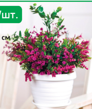
ГОРШОК ТОЛЕДО белый с поддоном