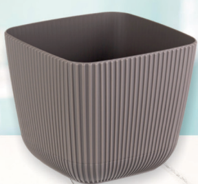
КАШПО ПИКАНТО французский серый