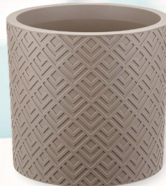
ГОРШОК СП РОТАНГ ЭТНА французский серый