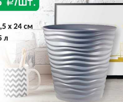
КАШПО ДЮНА серый