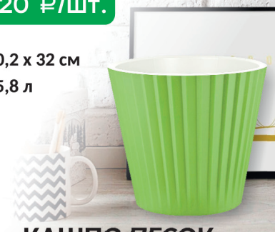
КАШПО ПЕСОК со вставкой на колесах. зеленая фисташка

Внимание: реклама не является офертой. Все цены действительны на момент выхода рекламы. Количество товара ограничено.