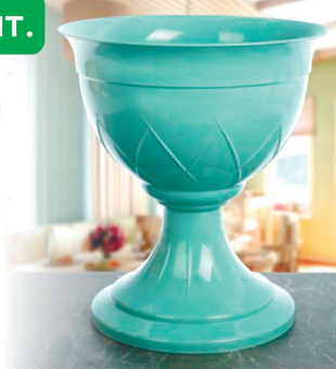
КАШПО ЛИЛИЯ на ножке, нефрит