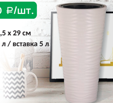
КАШПО ОАЗИС бежевый