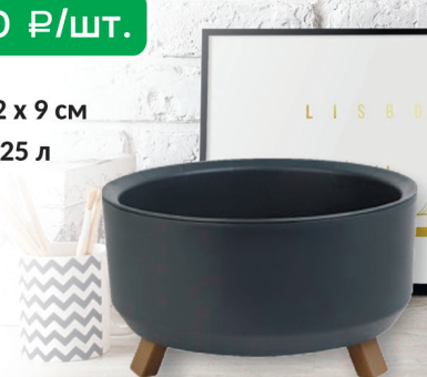
КАШПО ГРАЦИЯ ПРАЙМ антрацит