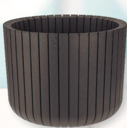
КАШПО ШАТО коричневый ротанг