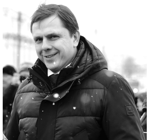
Анонс. Губернатор Андрей Клычков.

Речь у нас в этом расследовании пойдёт не о жизни юных афроафриканцев в Орле, а о народных депутатах. «Орловская среда-плюс» уже обозначала эту тему. Почти половина Орловского окружного Совета, если тщательно соблюдать антикоррупционное законодательство, могла бы покинуть свои посты в связи с утратой доверия. Но добрый губернатор Андрей Клычков их простил. А других депутатов пока простил суд. Прокрутура против.