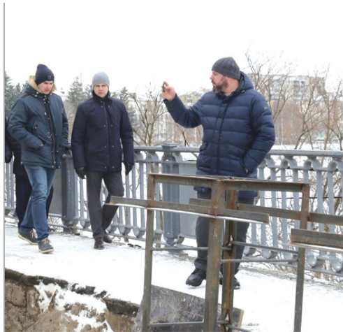
Из троих персонажей на фото только губернатор Клычков на свободе. Лежнев в СИЗО, Подрезов в колонии