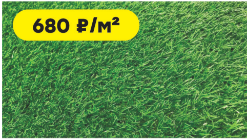
Трава искусственная Wuxi NGS-1812 высота ворса 18 мм