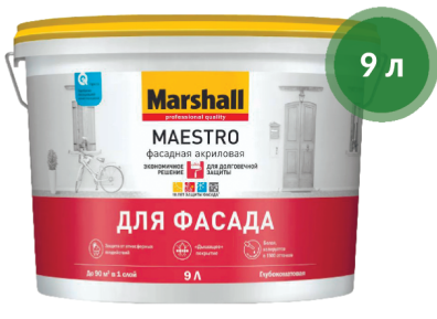
Краска Maestro фасадная / Marshall