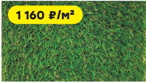
Трава искусственная Деко с ребром жесткости/высота ворса 20 мм