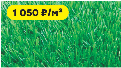
Трава искусственная Wuxi SALG-2516 высота ворса 25 мм