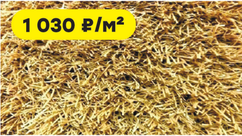
Трава искусственная Деко бежевая с ребром жесткости/высота ворса 20 мм