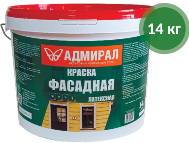
Краска фасадная / Адмирал