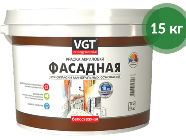
Краска ВД-АК-1180 фасадная / ВГТ