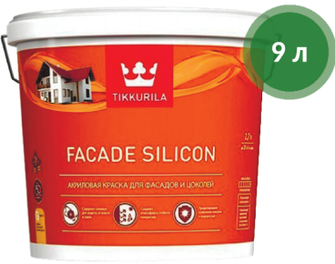
Краска FACADE SILICON фасадная / TIKKURILA