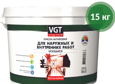
Краска ВД-АК-1180 для наружных и внутренних работ ВГТ