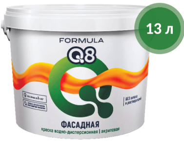
Краска фасадная / Formula Q8