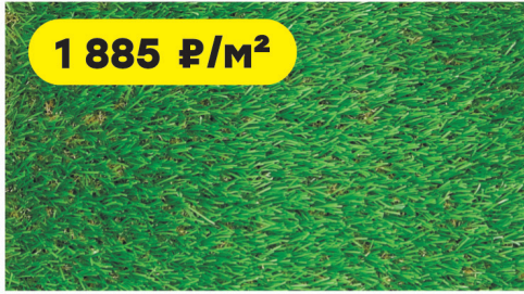
Трава искусственная Деко с ребром жесткости/высота ворса 50 мм