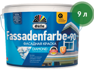
Краска ВД Fassadenfarbe RD90 фасадная / Dufa