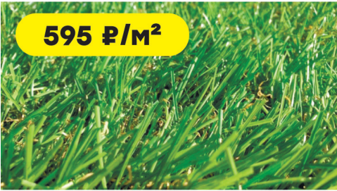
Трава искусственная Grass MIX высота ворса 18 мм