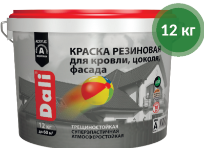
Краска резиновая для кровли, цоколя и фасада Dali