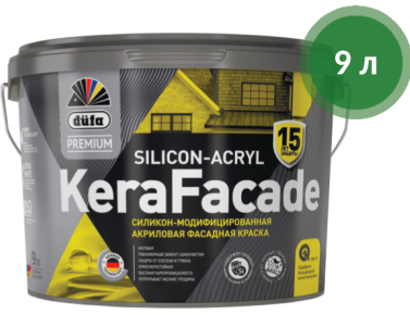
Краска KeraFacade силикон-модифицированная Dufa Premium