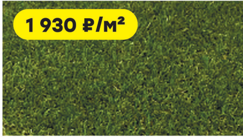
Трава искусственная Вудленд высота ворса 30 мм

Внимание: реклама не является офертой. Все цены действительны на момент выхода рекламы. Количество товара ограничено.