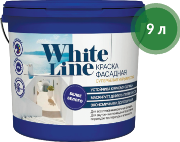
Краска фасадная / White line