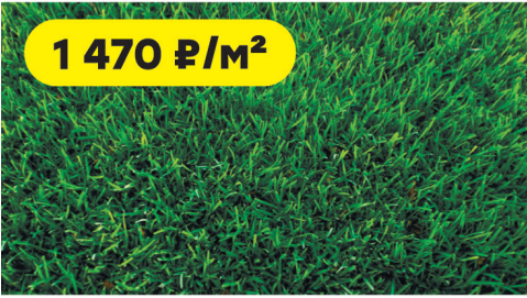
Трава искусственная Dream Floor высота ворса 35 мм