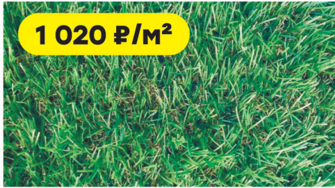
Трава искусственная Grass MIX высота ворса 30 мм