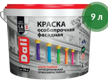
Краска фасадная особопрочная / Dali