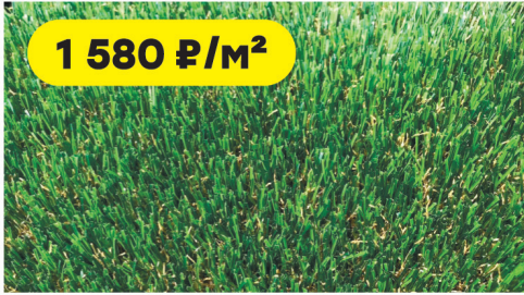
Трава искусственная Wuxi UQS-3516 высота ворса 35 мм