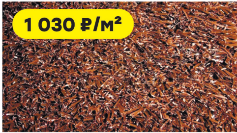
Трава искусственная Деко коричневая с ребром жесткости/высота ворса 20 мм