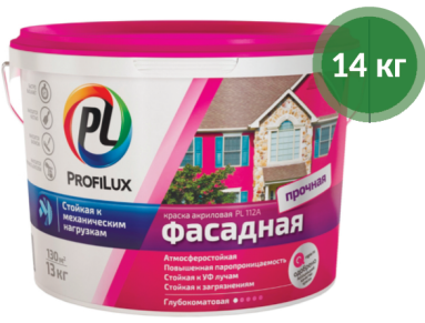
Краска ВД PL-112A фасадная / Profilux