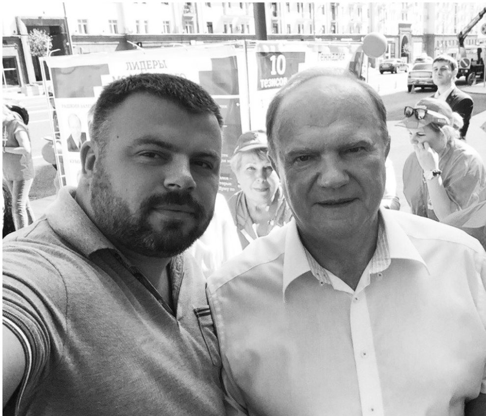
Лежнев и Зюганов.