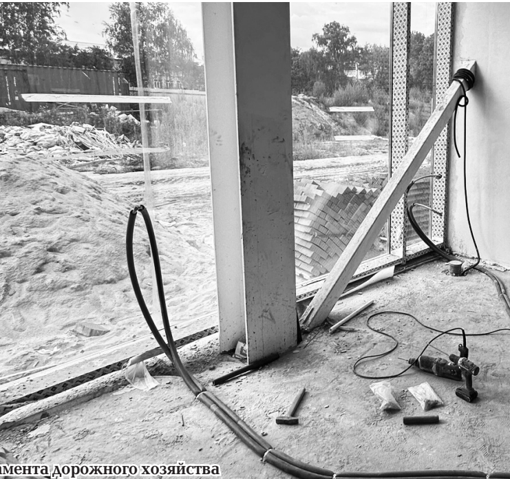
О строительстве физкультурно – спортивного комплекса на улице Матвеева