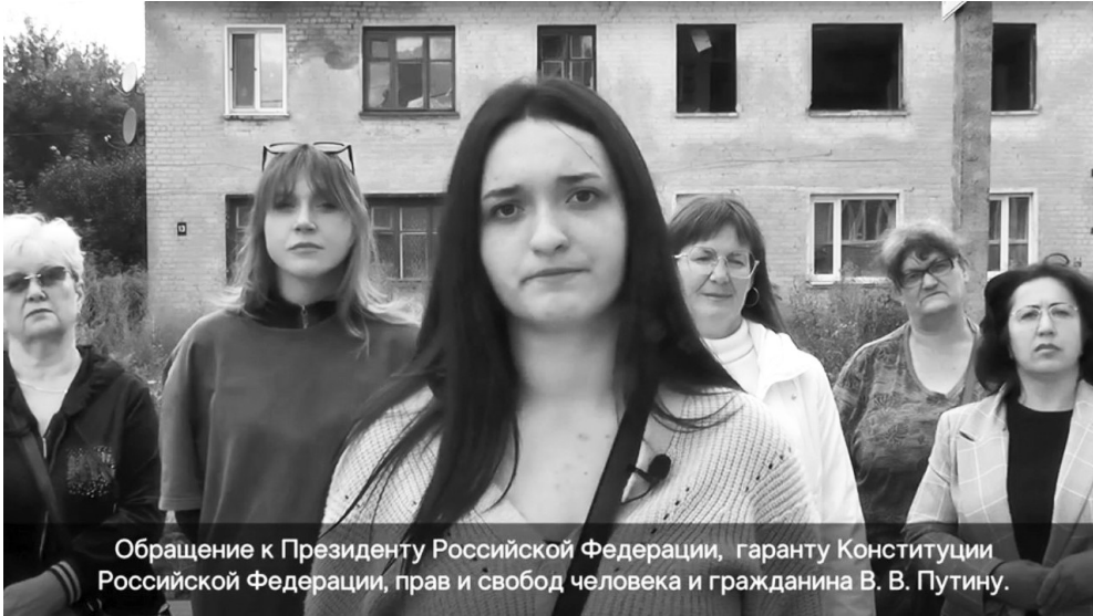
Обращение к Президенту Российской Федерации, гаранту Конституции Российской Федерации, прав и свобод человека и гражданина В. В. Путину.