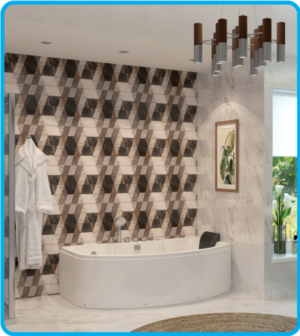
Ванна акриловая Дюна на X-каркасе

Акриловые ванны идеальны для современной ванной комнаты благодаря разнообразию форм и дизайнов. Они легки в установке, долговечны и гигиеничны. Некоторые акриловые ванны оснащены гидромассажем для комфорта и расслабления.