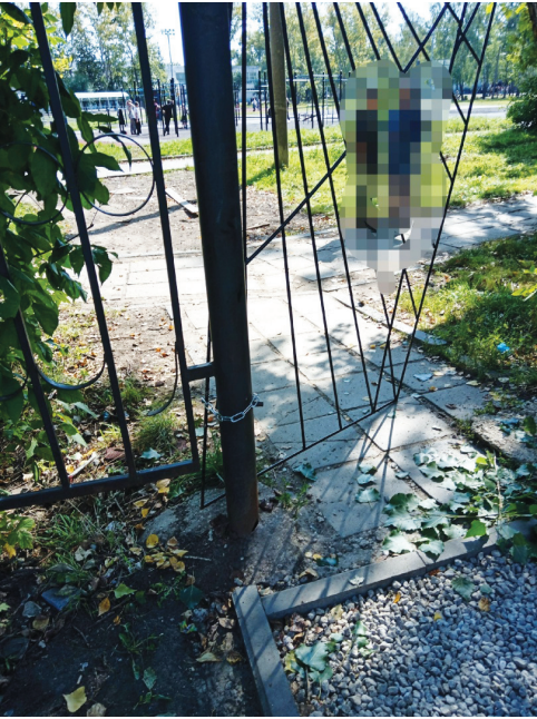
Вот через этот вход предлагают пройти детям