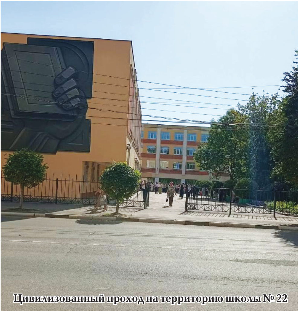
Цивилизованный проход на территорию школы № 22