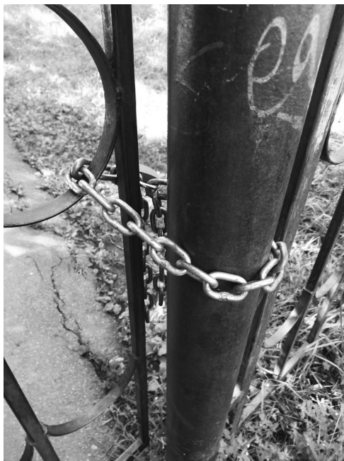
Фото — Покупка Орел

«Сегодня была в школе на регистрации, расскажу про очередное новаторство. Сразу скажу: школа здесь особо ни при чем, она выполняет