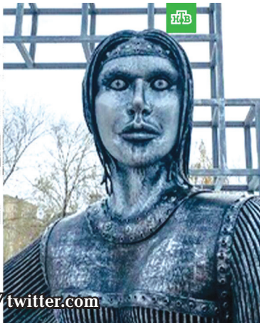
В Воронеже — Алёнка, в Орле — Параша

фигуры, но и ее внешний вид. Эмоций комментаторы не скрывали: